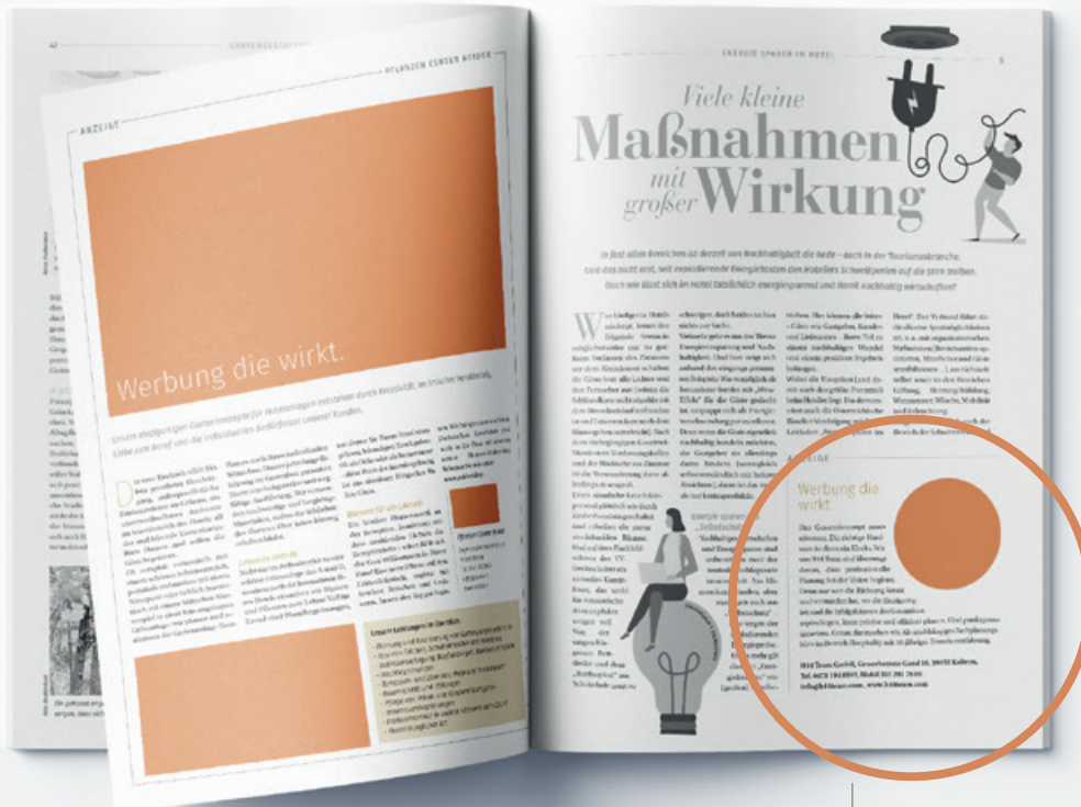
Ganze Seite redaktionell

Die Angaben verstehen sich inkl. Leerzeichen.