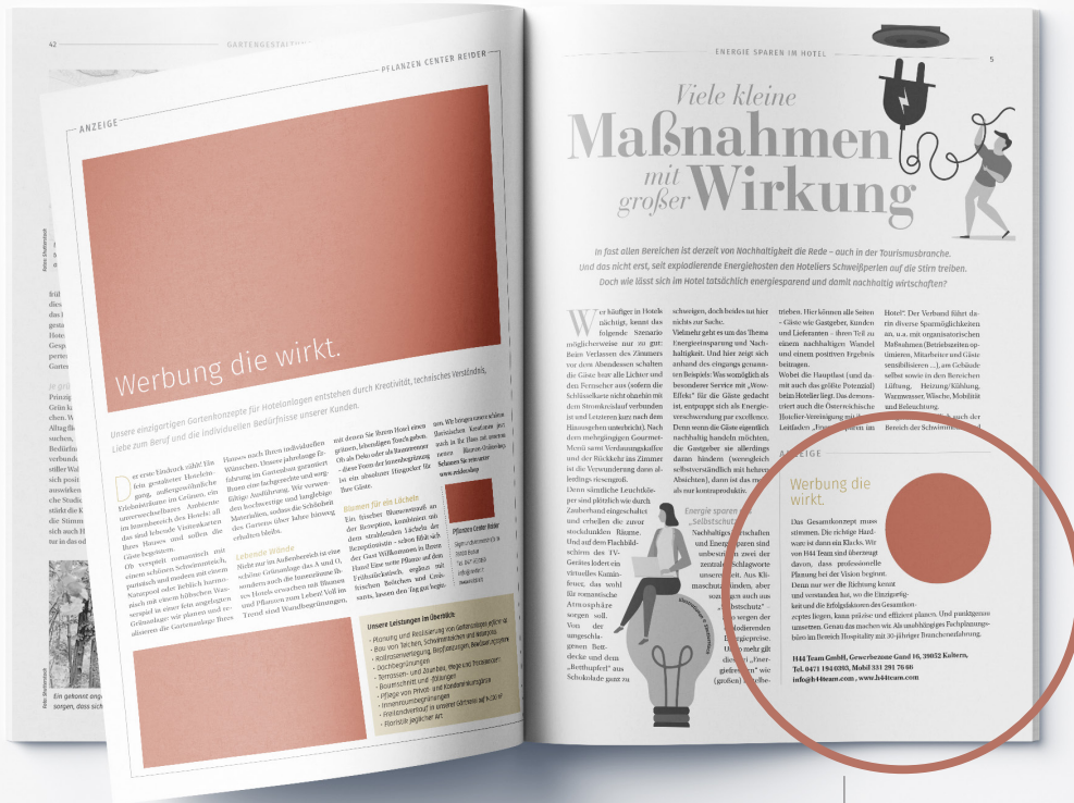
— Ganze Seite redaktionell

Die Angaben verstehen sich inkl. Leerzeichen.