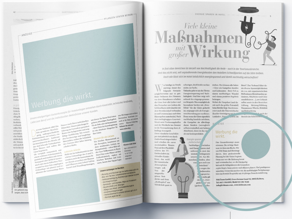
Ganze Seite redaktionell

Die Angaben verstehen sich inkl. Leerzeichen.