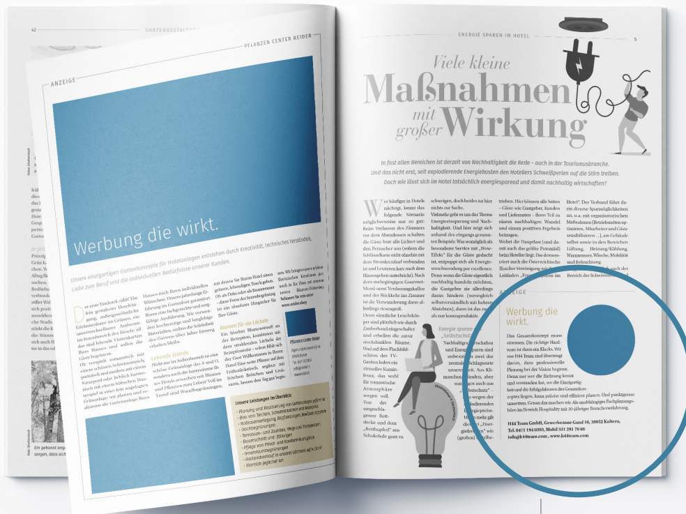
— Ganze Seite redaktionell

Die Angaben verstehen sich inkl. Leerzeichen.