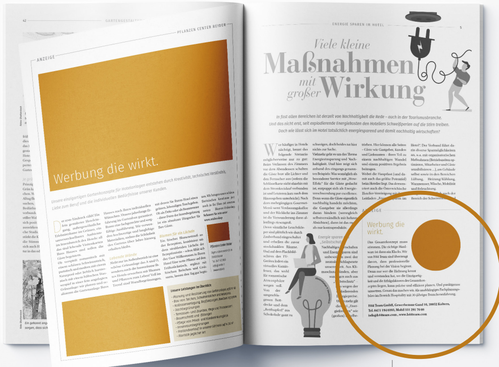
Ganze Seite redaktionell

Die Angaben verstehen sich inkl. Leerzeichen.