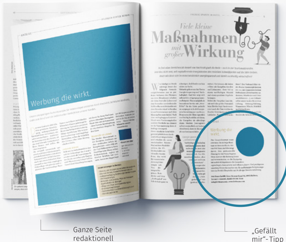
Ganze Seite redaktionell

Die Angaben verstehen sich inkl. Leerzeichen.