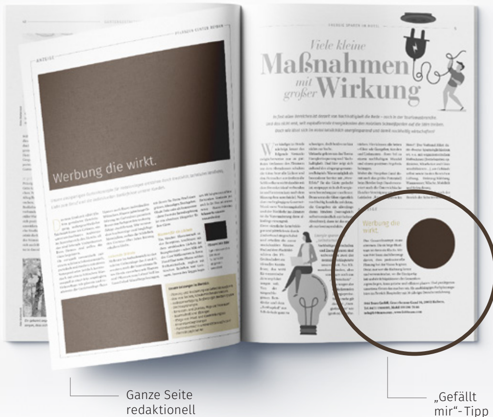
Ganze Seite redaktionell

Die Angaben verstehen sich inkl. Leerzeichen.