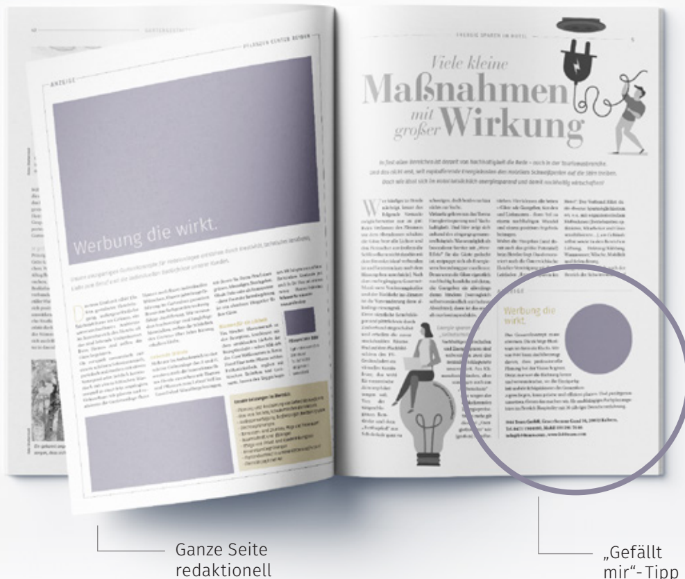
— Ganze Seite redaktionell

Die Angaben verstehen sich inkl. Leerzeichen.