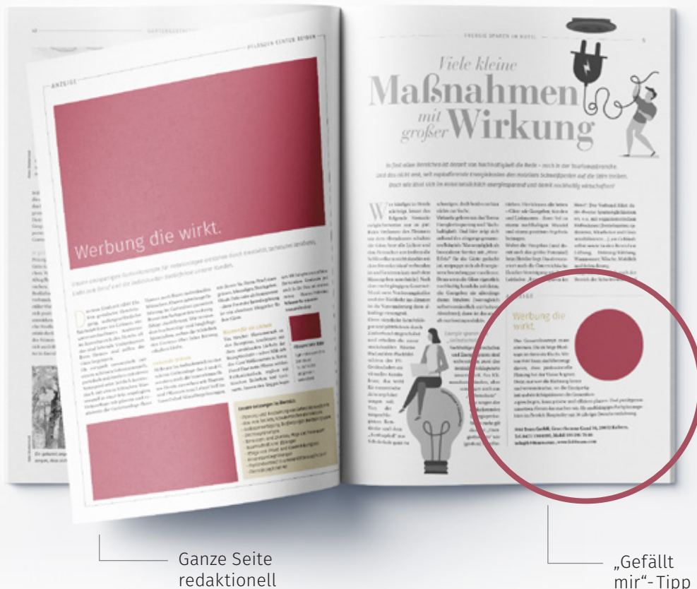
Ganze Seite redaktionell

Die Angaben verstehen sich inkl. Leerzeichen.