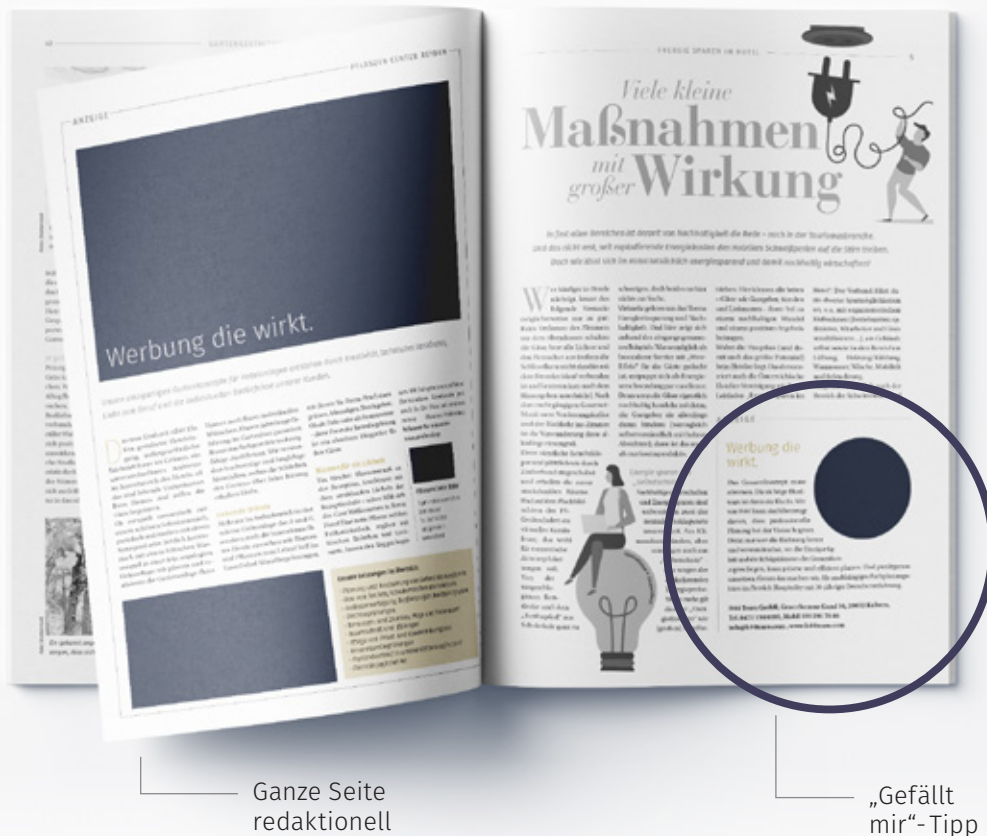
Ganze Seite redaktionell

Die Angaben verstehen sich inkl. Leerzeichen.